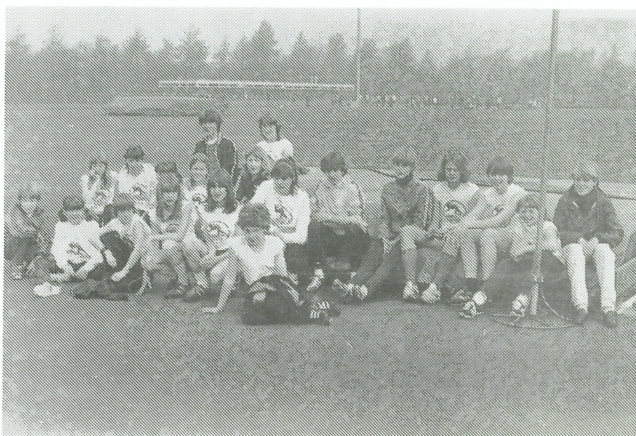
2e jaars D en C-meisjes