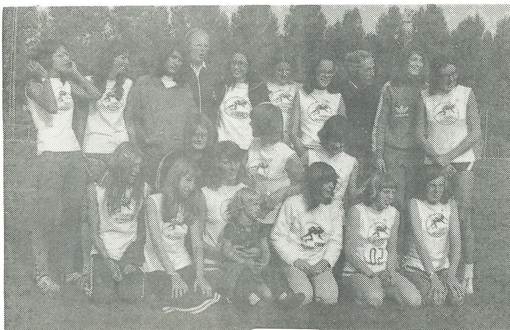
Ned. Clubkampioen Meisjes 1973