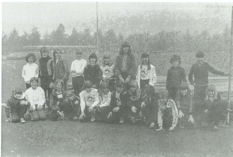
Pupillen en 1e jaars D-meisjes