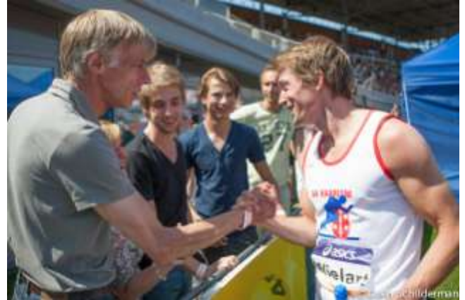
De oude en de nieuwe kampioen

De vorige AV Haarlemmer die bij de senioren mannen Nederlands kampioen werd heette ook Wielart. Vader Ruud sprong precies 25 jaar eerder naar de eerste plaats bij het hoogspringen. In Groningen was 2,14 meter de hoogte waarmee hij op 16/17 juli 1988 Nederlands kampioen werd.