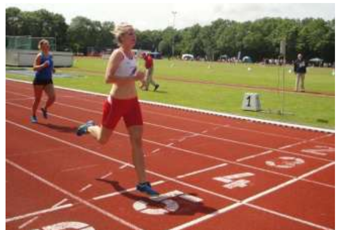
Finish van Kim op de 400 m