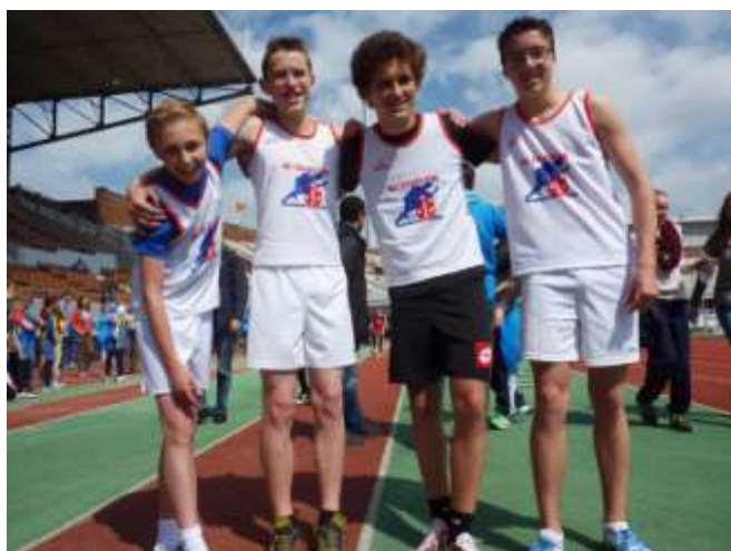
Jongens C, de 4x100 meter ploeg