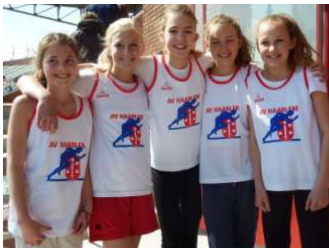
Vijf van de D-meisjes in het Olympisch Stadion

Ook bij het speerwerpen behaalde ze deze plaats, al zat ze met 23,79 meter wel ruim onder haar PR. Wie weet verbreekt ze ook hier binnenkort het clubrecord, want de 27,66 meter die al 21 jaar op het scorebord staat, is binnen haar bereik.